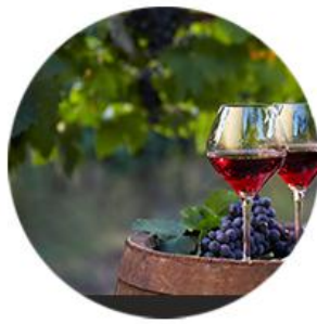
涩度适中 酸度活泼