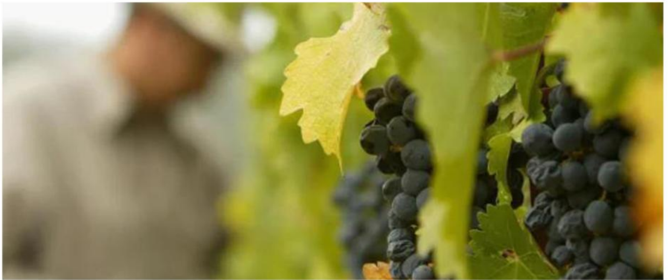
加州葡萄园的情况

跟往年相比，今年的采摘季提前了不少。这是因为度过冬季之后加州便进入了持续的高温天气，这让葡萄藤提早“醒来”，也提前了葡萄成熟的时间。