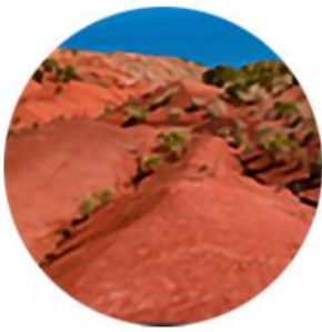
亚历山大谷 红土特色产区