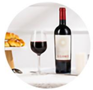
香气浓郁 单宁强劲