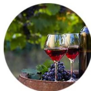
特色鲜明 超高性价比