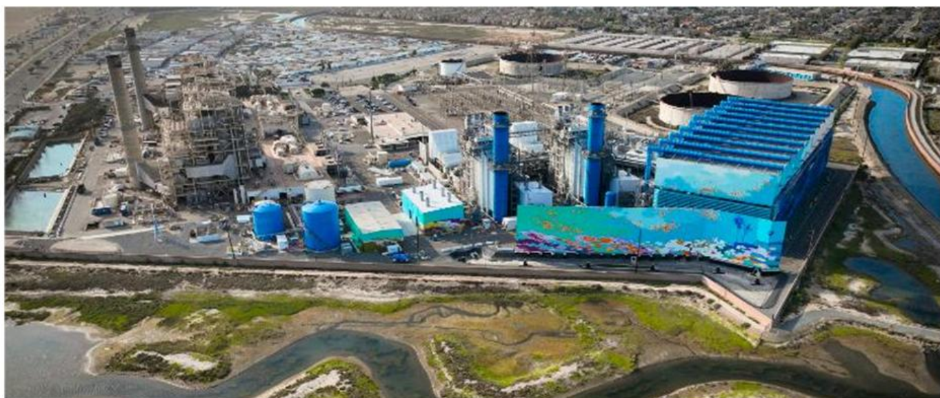
亨廷顿海滩能源中心的鸟瞰图

面对逐渐加重的用水危机，Poseidon Water多年来试图建造海水淡化工程，并表示工程建成后每天能够生产多达5000万加仑的饮用水，能够极大提高该地区抗旱能力。但根据今年五月中旬的报道，最终相关委员会及生态研究所和部分民众从成本、环境、能源及加州海岸的水位线等多角度考虑之后拒绝了价值14亿美元的海水淡化项目。