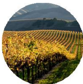
亚历山大谷 毗邻纳帕山谷